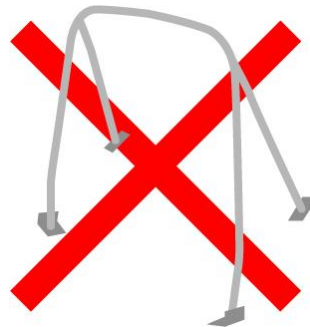
■リア4点式ロールケージは禁止